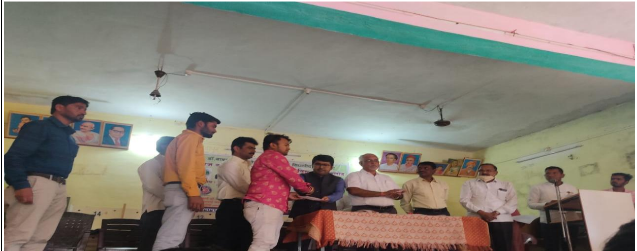
स्वयंसेवकांना प्रमाणपत्र वाटप करताना मान्यवर