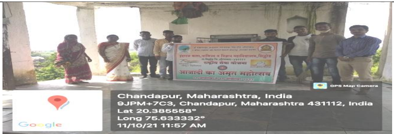
आजादी का अमृत महोत्सव