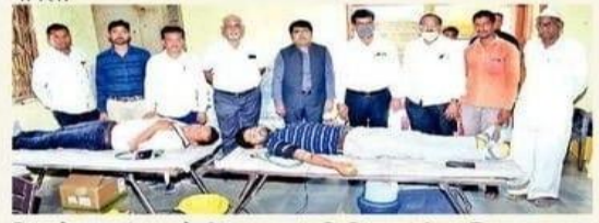
सिल्लोड : चांदापूर येथील रक्तदान शिबिराप्रसंगी उपस्थित मान्यवर.