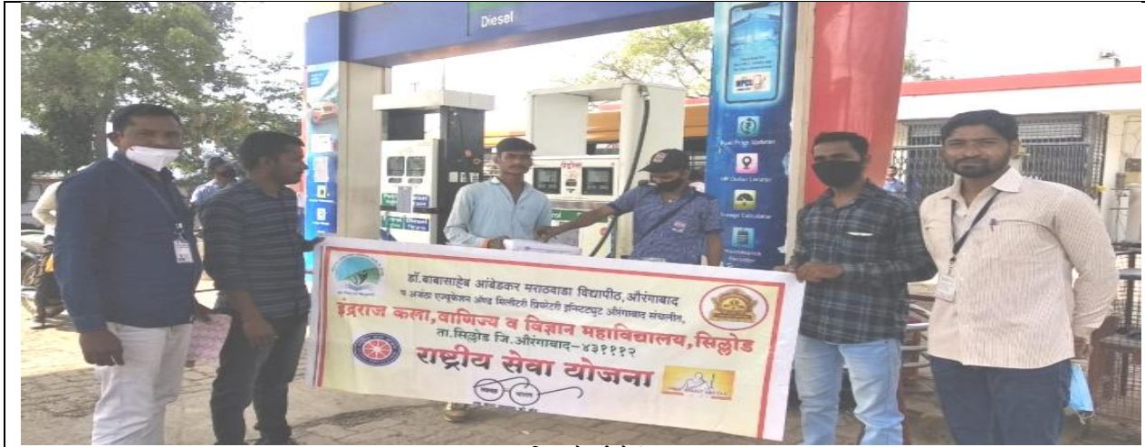
सांप्रदायिक सौहार्द मोहीम सप्ताह