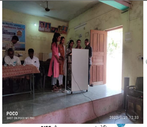
NSS गीत सादर करताना स्वयंसेविका