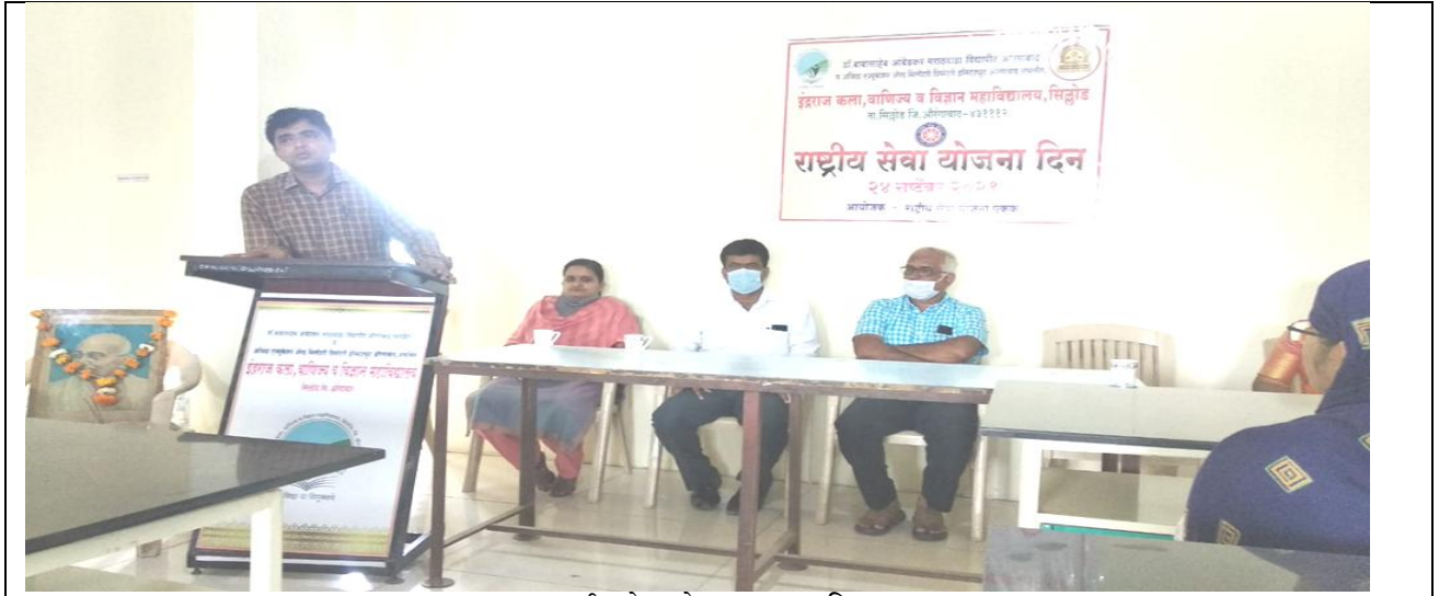
राष्ट्रीय सेवा योजना स्थापना दिवस