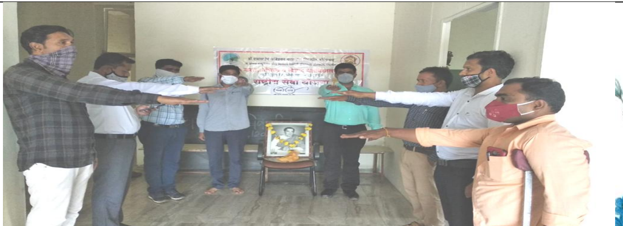
आंतरराष्ट्रीय योग दिवस