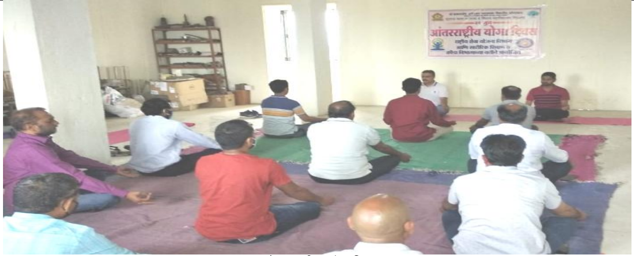
आंतरराष्ट्रीय योग दिवस