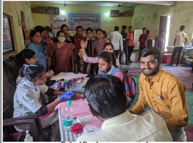
रक्तगट व हिमोग्लोबिन चेक करताना स्वयंमसेवक