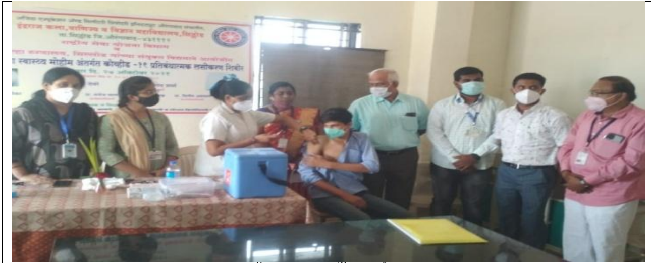
मिशन युवा स्वास्थ्य' कोविड-19 लसीकरण