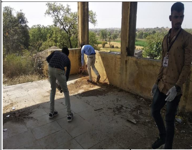
गावाची स्वच्छता करताना स्वयंमसेवक