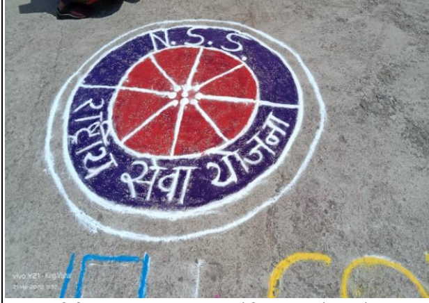
शिबिर उद्घाटन प्रसंगी NSS स्वयंसेविकांनी काढलेली रांगोळी