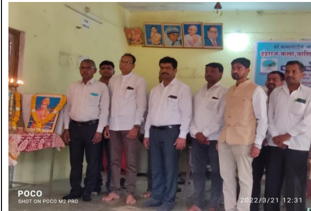
दीप प्रज्वलन करून कार्यक्रमाची सुरुवात करतानी मान्यवर