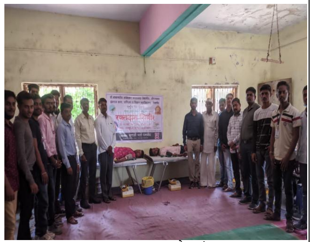
रक्तदान करताना गावचे सरपंच