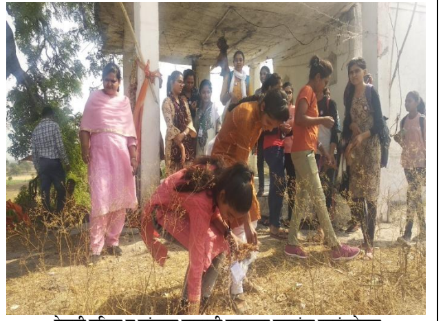
टेकडी परिसर व चांदापूर गावाची स्वच्छता करताना स्वयंमसेवक