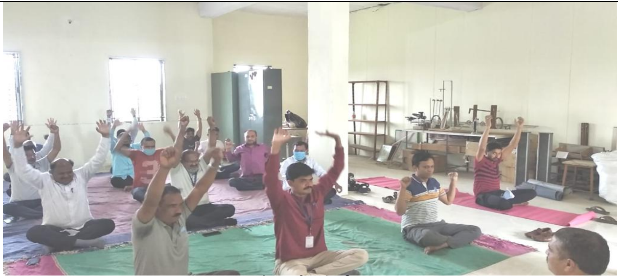
आंतरराष्ट्रीय योग दिवस