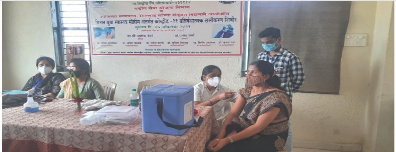
मिशन युवा स्वास्थ्य' कोविड-19 लसीकरण