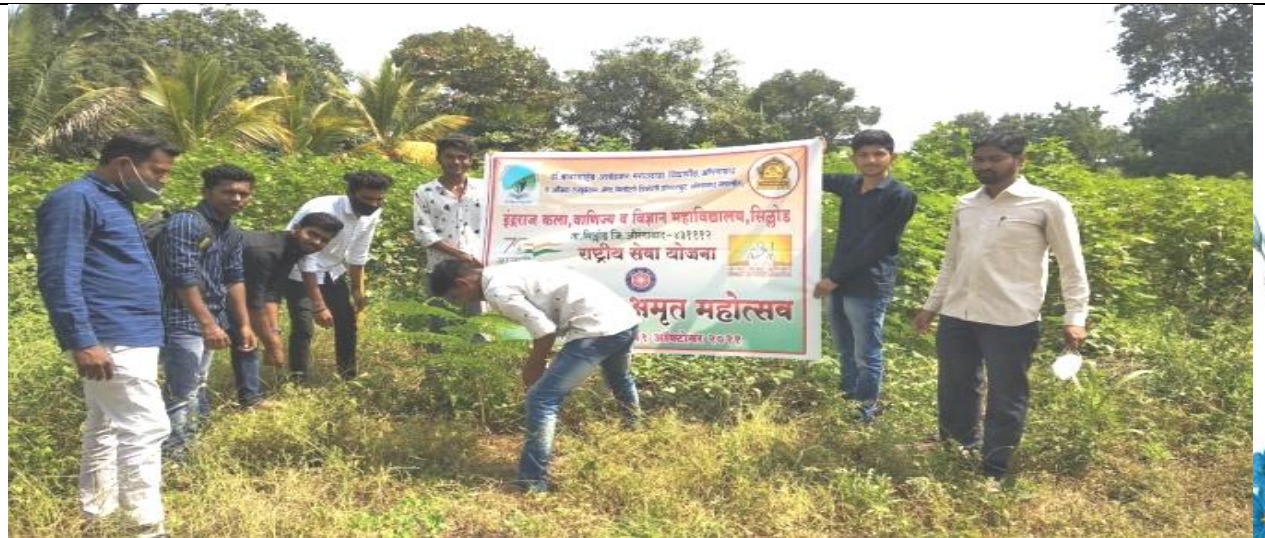
आजादी का अमृत महोत्सव