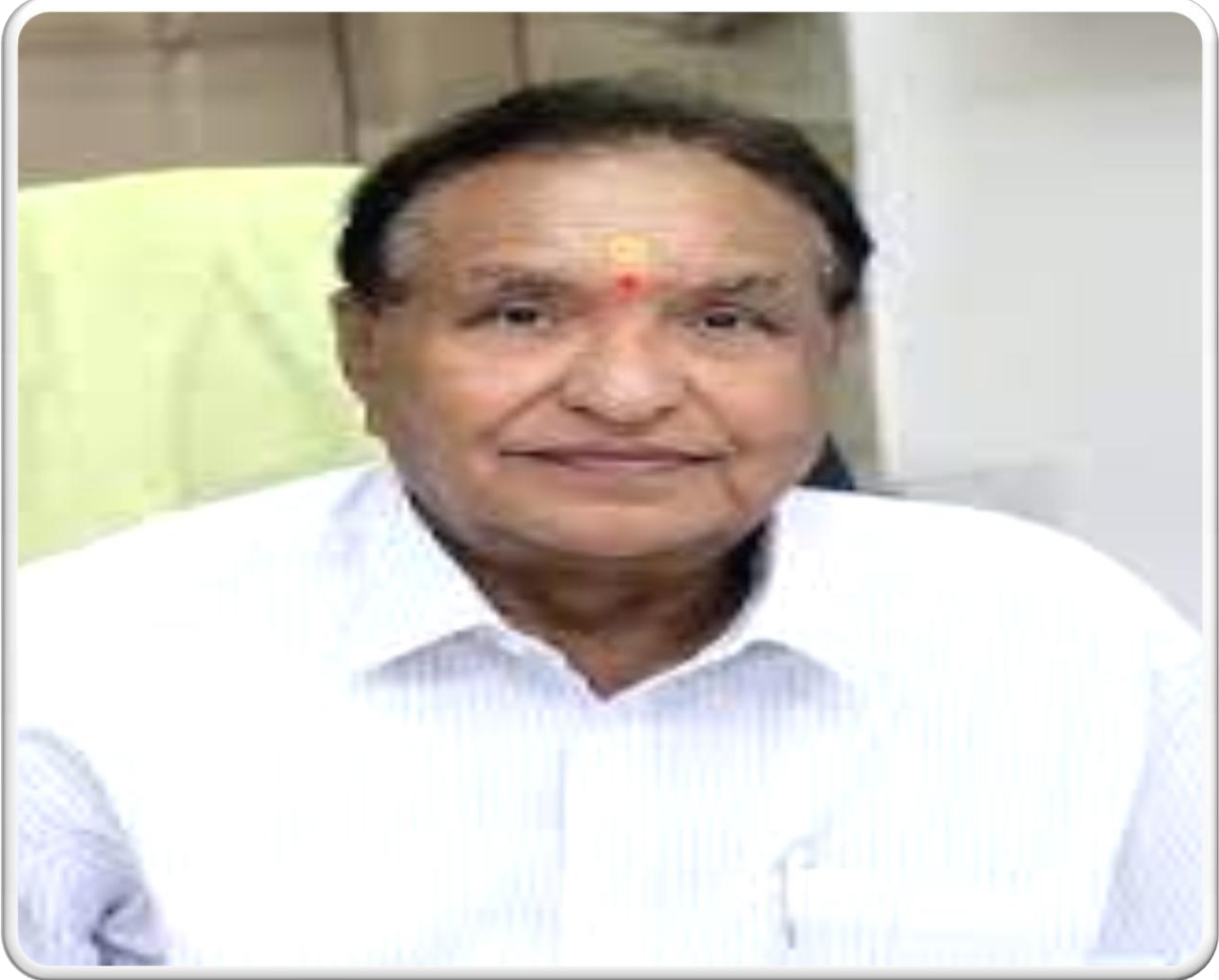
मरुजी खरसदरर मरु. श्री. उतुतमसिंरुगजी पवरर

अजिंठर एजुकेशन अँड मिलिटरुी प्रिपरेटरी इन्स्टिटयुट, औरंगरबरद अध्यकुष