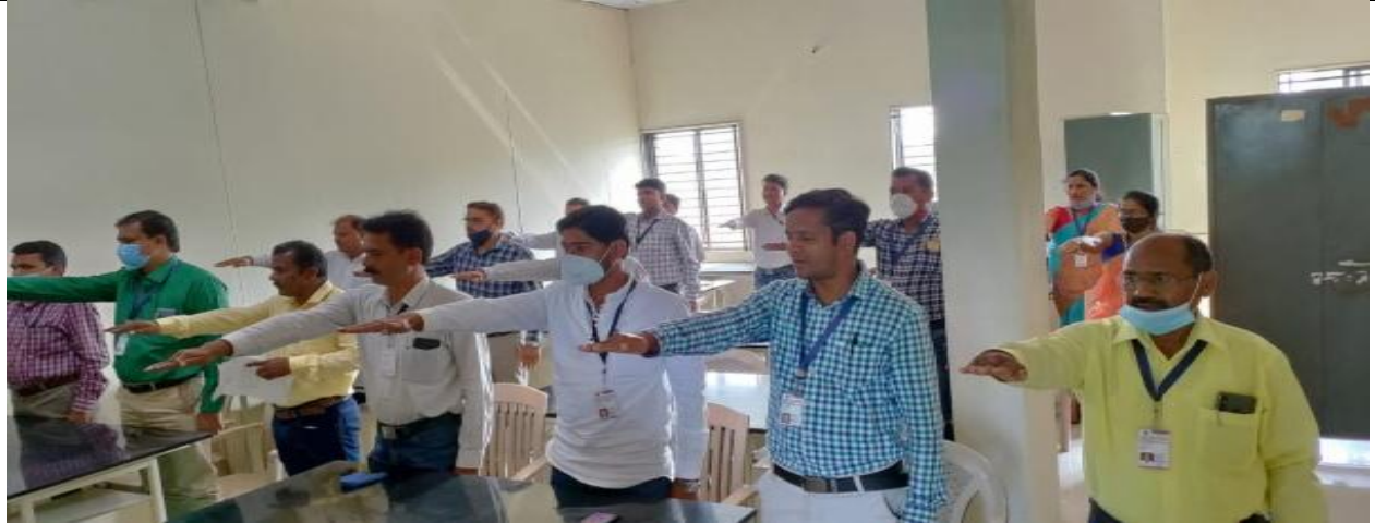
राष्ट्रीय सेवा योजना स्थापना दिवस