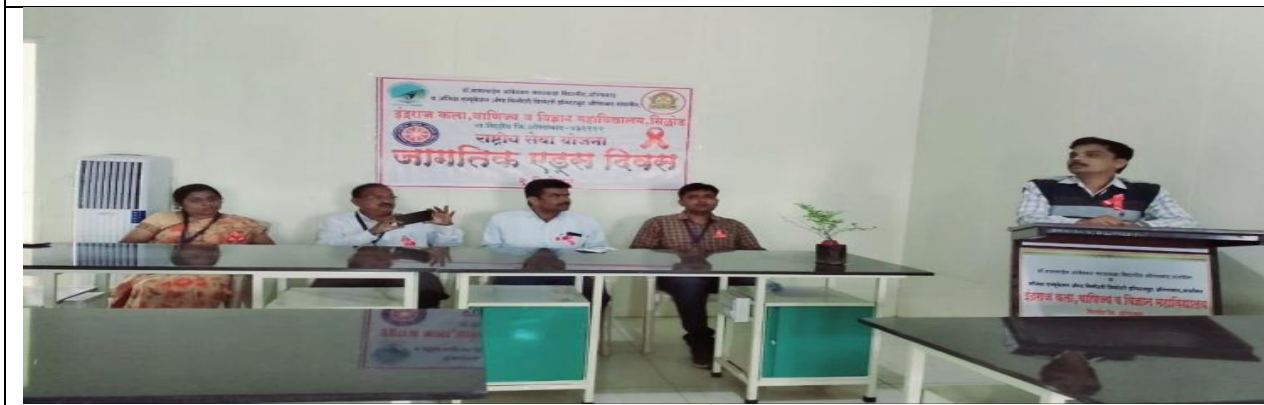
आंतरराष्ट्रीय एड्स दिवस