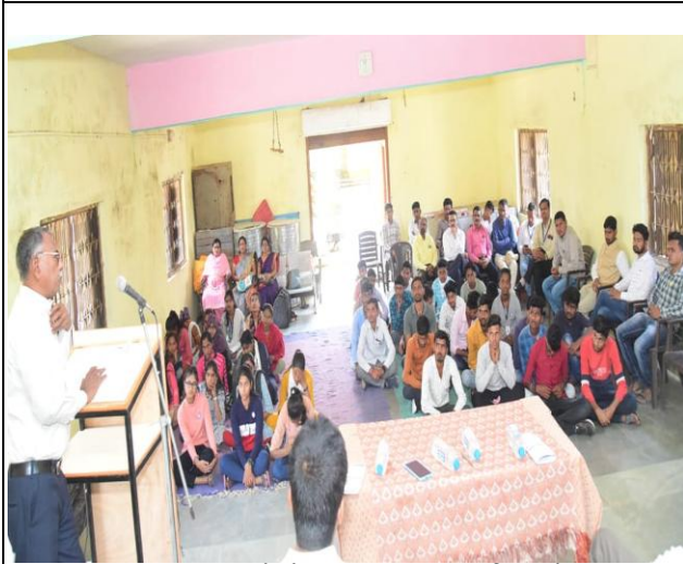
उद्घाटन प्रसंगी मार्गदर्शन करताना आदरणीय सचिव साहेब