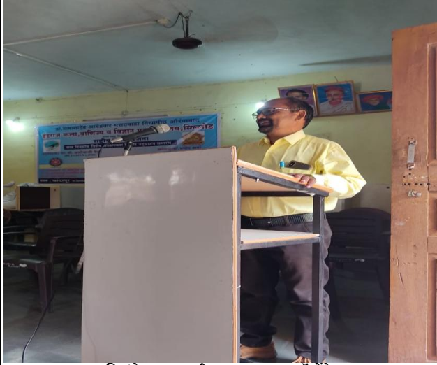
कविसंमेलनात कवी सादर करताना डॉ मंढे सर