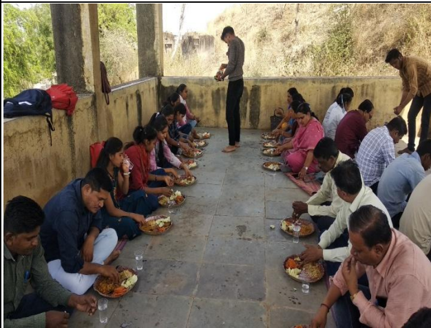
जेवणाचा आस्वाद घेताना स्वयंसेवक