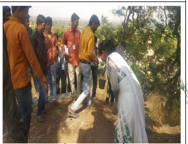
गावाची स्वच्छता करताना स्वयंमसेवक