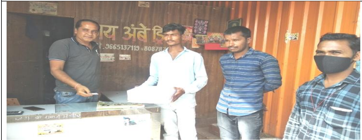
सांप्रदायिक सौहार्द मोहीम सप्ताह