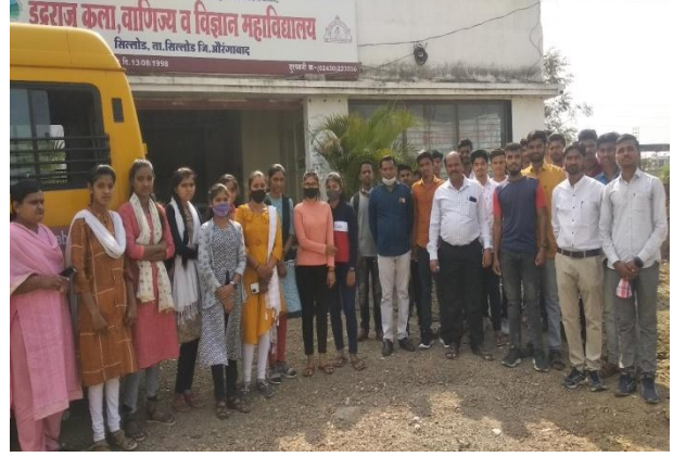
महाविद्यालयातून NSS कॅम्प साठी मौजे चांदापूर येथे निघताना स्वयंसेवक