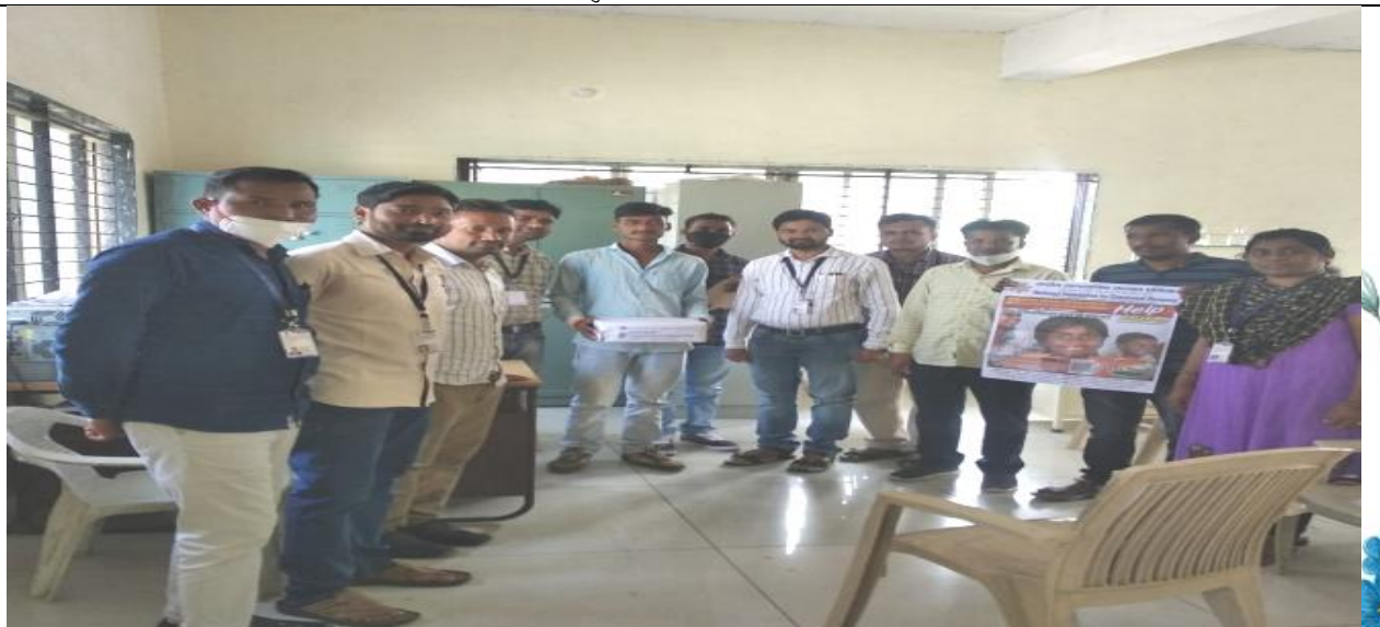
सांप्रदायिक सौहार्द मोहीम सप्ताह