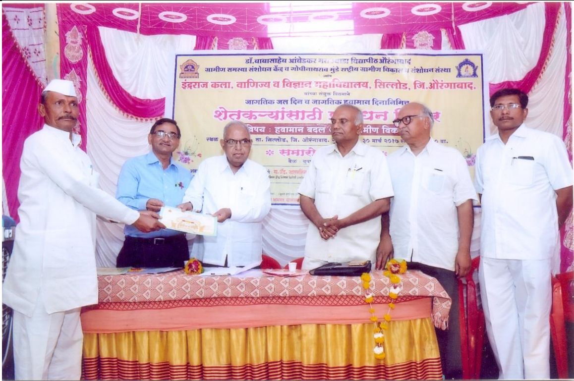
Some glimpses during certificate distribution to the farmers