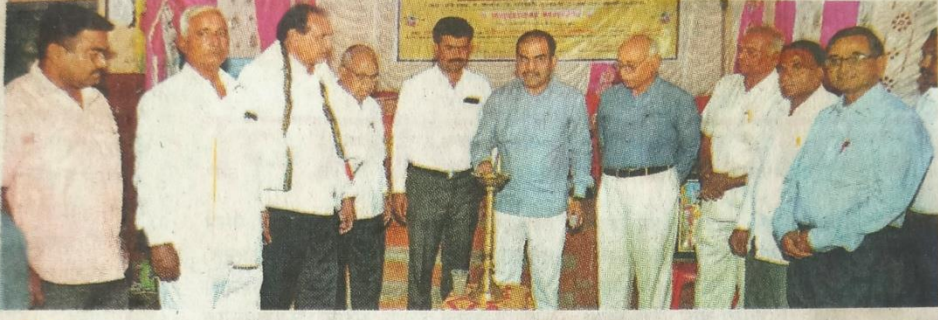
अजिंठा : शेतकरी शिबिराचे दीपप्रज्वलन करून उद्घाटन करताना मान्यवर.