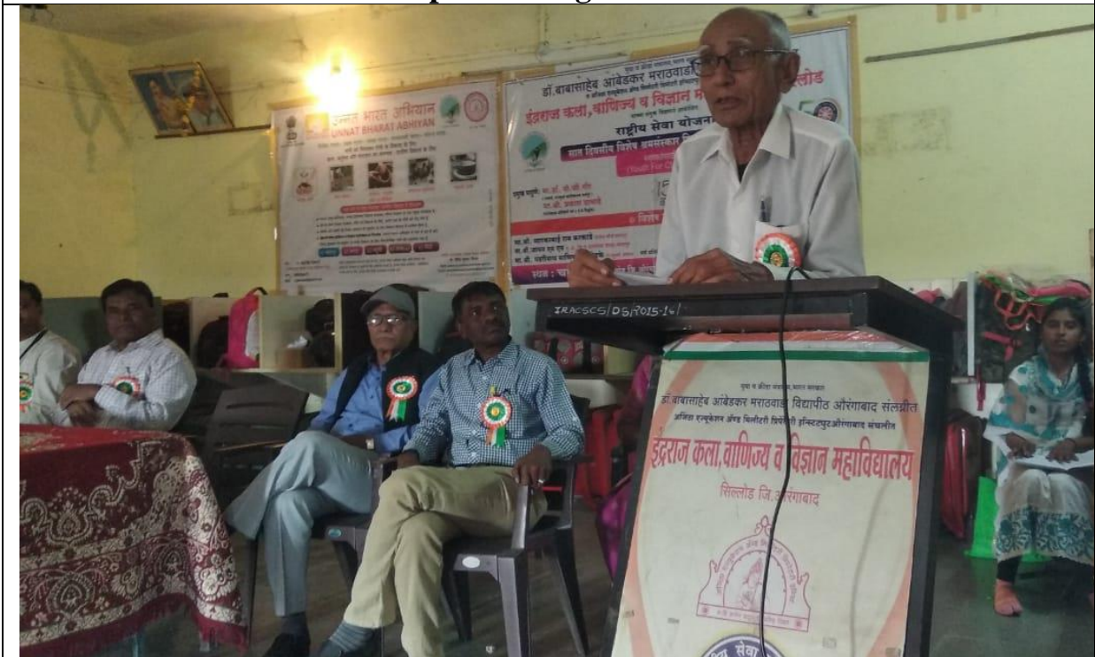
Guest of Honour interacting with farmer