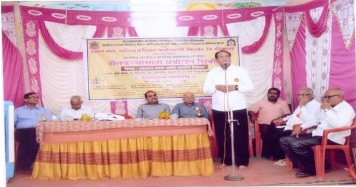
Presidential talk of Hon. Ex. MP. Shri. Uttamsing Pawar