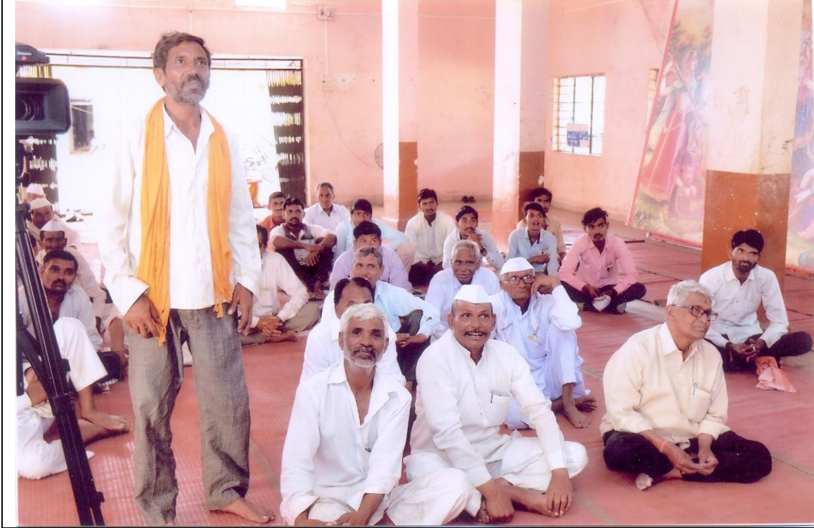
Farmers Participated in this farmers meet workshop