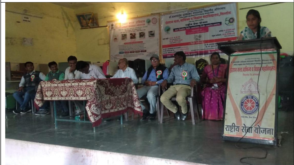
The student introducing the guest and the Chairperson of program