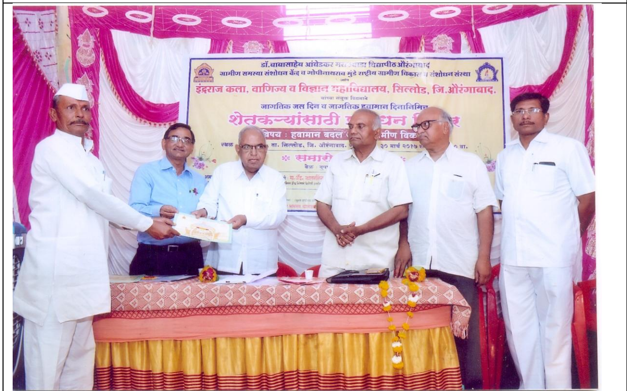
Some glimpses during certificate distribution to the farmers